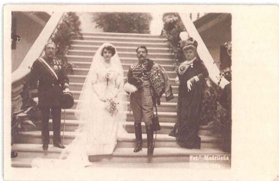
Voda de Blanca Quiroga Pardo Bazán e José Cavalcanti. De esquerda a dereita Antonio Tovar e Marcoleta, vestido con uniforme militar de gala (representando ó infante don Fernando de Borbón que ía se-lo padriño da cerimonia); Blanca, co traxe de noiva; José Cavalcanti, con uniforme militar de gala, e Emilia Pardo Bazán (representando á infanta dona María Teresa de Borbón) (24-10-1904).