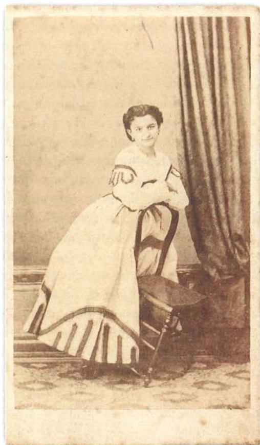
Emilia Pardo Bazán (1863-1867).