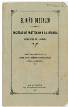
Reglamento de El Niño Descalzo. 1907 (ARG. FMB).