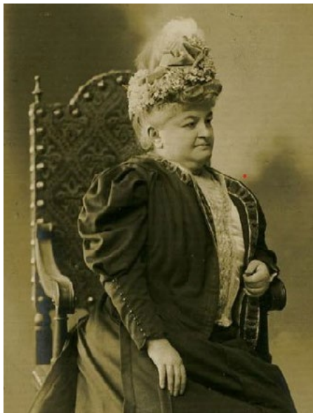
Emilia Pardo Bazán nos anos da colaboración solidaria coas causas benéficas na Coruña.

A pesar dos avances lexislativos en materia de protección social iniciados cos gobernos liberais, as carencias eran infinitas e non cubrían as mínimas necesidades da poboación, especialmente da máis necesitada como era a infancia e os enfermos pobres. En auxilio destes necesitados acudiron moitas mulleres, especialmente as pertencentes aos grupos máis acomodados da sociedade, movidas polos sentimentos de compaixón, caridade e amor aos máis desvalidos. Na Coruña destacaran mulleres de recoñecida valía nestes ámbitos (Teresa Herrera, Juana de Vega, Concepción Arenal, Asociación de Señoras), os únicos espazos que permitían ás mulleres instruídas exercer influencia social participando nas escasas marxes da súa implicación na vida civil. Os casos analizados neste estudo marcan diferenzas con institucións similares existentes nas décadas anteriores, pois xa non están baixo a tutela dos varóns senón que son as mulleres as principais organizadoras e dirixentes, marcando así unha positiva evolución no papel da muller na sociedade da época.