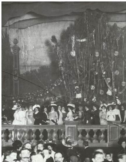
Árbore de Nadal no Teatro Principal en decembro de 1908.