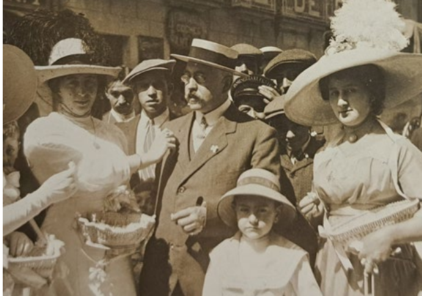
RAG. Celebración da primeira Festa da Flor na Coruña en 1912.

paralizar los golpes del enemigo oculto, que a ella personalmente no le alcanzaron porque su prestigio era aún mayor que la ruindad de los ruines». (Barbeito Cerviño, 2021: 84).