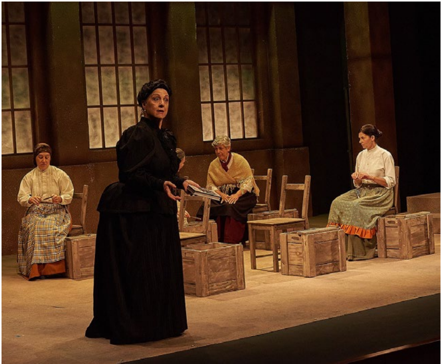
Emilia e cigarreiras