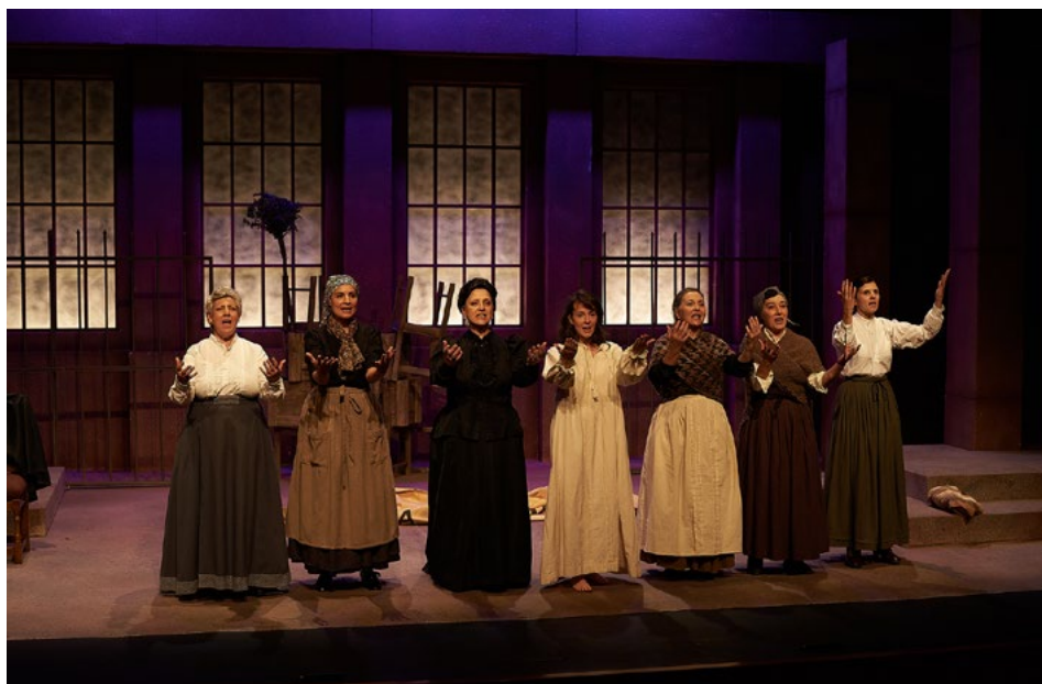
Emilia y cigarreras