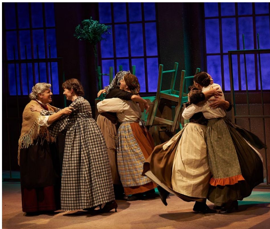
Cigarreras y barricada